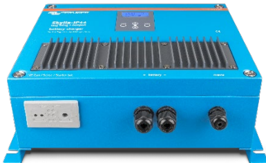
Skylla-IP44 12/60 (1+1)

Další informace o bateriích a nabíjení baterií naleznete v naší knize "Energy Unlimited" (k dispozici zdarma od firmy Victron Energy a ke stažení na adrese www.victronenergy.com ).