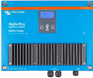
Skylla-IP44 12/60 (1+1)